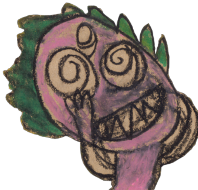
Biruto da Meia-Noite

JANELA E VAI PARA O CASTELO BRINCAR E CONVERSAR COM O MONSTRO.