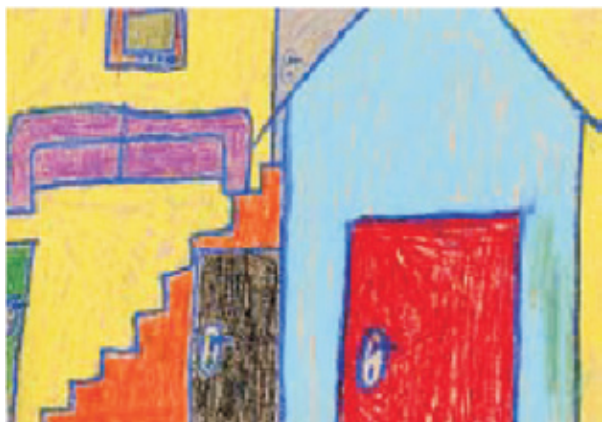
A casa de Titico