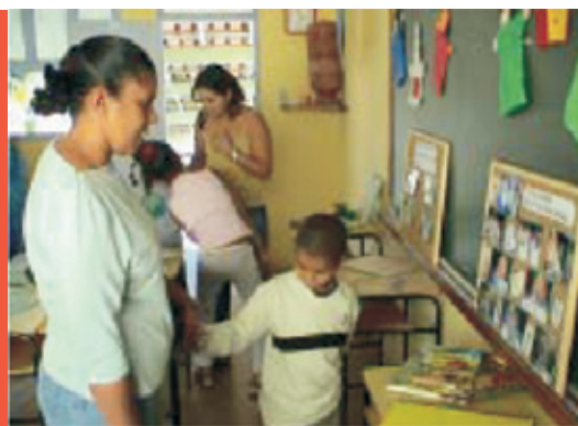
Um aluno conduz a mãe para apreciar seus trabalhos.

O portfólio e sua apresentação é um importante instrumento utilizado pelos professores para fazer intervenções e nas reuniões com os pais eles testemunham as capacidades dos alunos e que muitas vezes ainda não foram reconhecidas ou foram negadas de forma inconsciente pelos pais. Os alunos se auto-avaliam e podem assim perceber o quanto avançaram em relação a um tema de estudo, refletindo sobre suas produções.